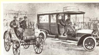
Первый бензиновый автомобиль, появившийся в России — «Панор-Лексдор» 1894 года. Справа — машина той же марки 1902 г.